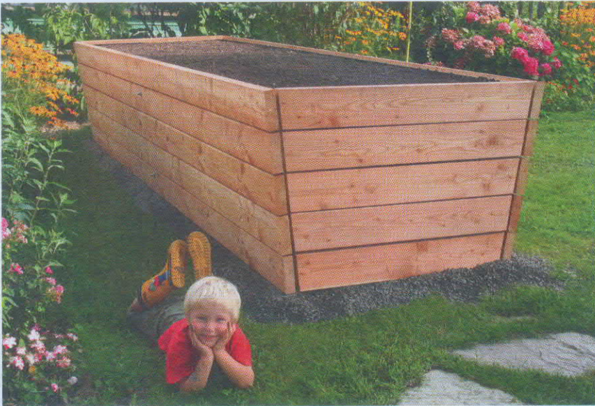
Seiringer Hochbeete - auf Wunsch wird das Hochbeet mit Seiringer-Erde befüllt und zugestellt!

Regionale Produkte, Natur und Gärten liegen im Trend – und das zu Recht! Regionalität vom Boden bis zur Frucht ist das Motto! Dazu braucht es allerdings eine gute Basis: Erde und Kompost! Mit der neuen noch besseren Bio-Gartenerde von Seiringer ist das kein Problem!